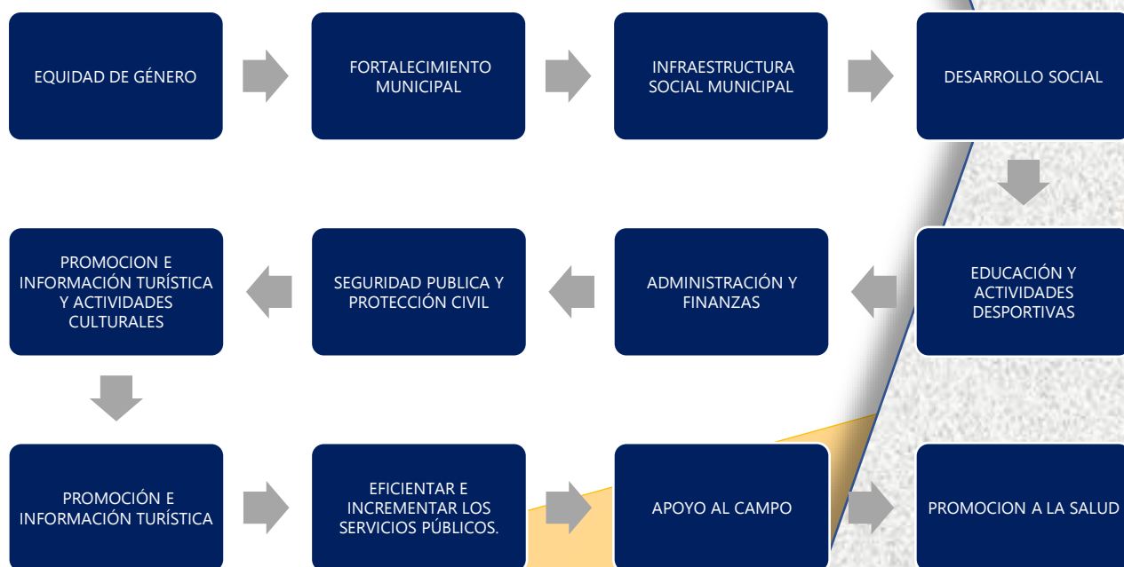
Tabla 9. Programas Presupuestarios 2021.

De acuerdo con los 9 Programas Presupuestarios 2021, permitirá medir su cumplimiento del Plan Municipal de Desarrollo 2019-2021, mediante los procesos administrativos implementados.